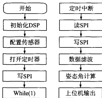
图 2 流程图

本文采用 DSP(TMS320F2812)完成数据的滤波和姿态角解算 [7] 。本文通过定时器中断对传感器数据进行定时采样和处理。主程序流程图如图 2 所示。