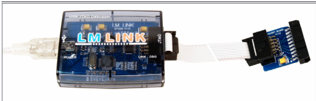
图 1 LM LINK 调试器

如图 1 所示，LM LINK 是由广州致远电子有限公司开发产的低成本高性能 USB JTAG 调试器。